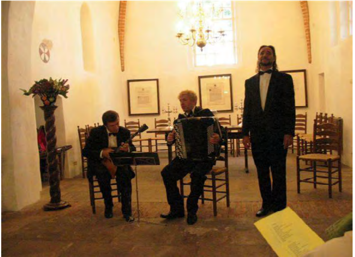
Trio Parafraz is regelmatig in Nederland geweest en heeft opgetreden in vele kerkjes

Naast zijn werk als muzikant gaf hij 32 jaar les aan het Muziekcollege van Moermansk. Hij wist jongeren enthousiast te maken voor de volksmuziek. Als leraar was hij populair en geliefd en stond altijd klaar voor zijn studenten.